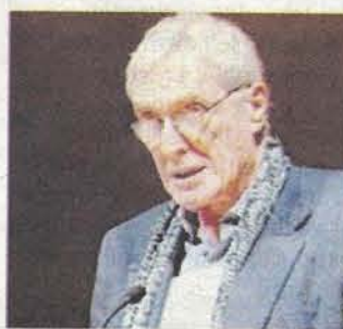
Ospiti illustri Il dipartimento di Letteratura inglese organizza conferenze con gli scrittori e i più illustri poeti americani. A gennaio torna alla Cabot il grande poeta e premio Pulitzer Mark Strand. I ragazzi potranno colloquiare con lui informalmente in terrazza

«Gli stage sono importanti perché quasi nessuna università li fa - spiegano alla Cabot - danno a un ragazzo di 21 anni appena laureato un curriculum pazzesco. Li organizziamo alla presidenza del Consiglio dei Ministri, alla Fao, alle agenzie di stampa straniere, nelle aziende multinazionali, ovunque e personalizzati». Il corpo docente è selezionato: vengono da Oxford, Cambridge, Harvard, Princeton ecc. «Il nostro messaggio agli studenti è se vuoi molto una cosa ci riuscirai perché qui avrai talmente aiuto e supporto che il tuo sogno si può esaudire». Insomma il «Yes we can» obamiano, il sogno che fa andare avanti l'America «un grande minestrone di razze dove alla fine vince la certezza che se tu vuoi una cosa e ti sacrifici ce la fai».